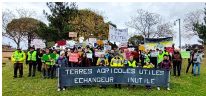
Pas besoin d'échangeur autoroutier pour le territoire de CC Drôme Sud Provence Manifestation le 7 décembre 2024